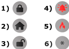
Fig. 2 Functions